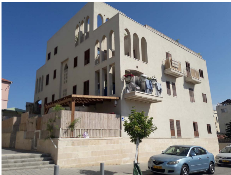
תצלום 3. פרויקט האתרוג