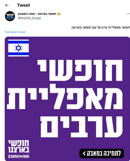
מתוך ציוץ של מטה המאבק בטוויטר