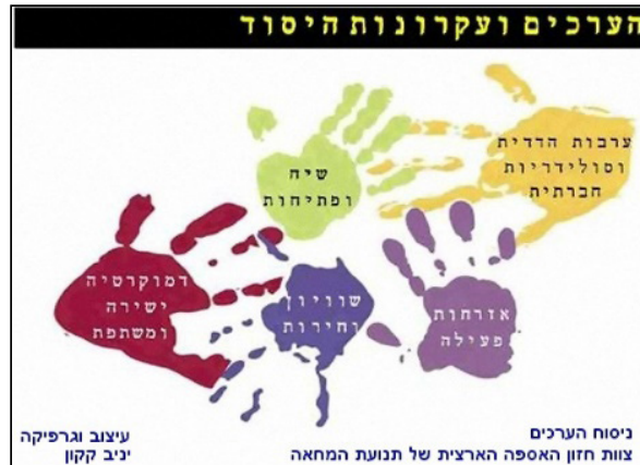
כרזה של ערכי היסוד שנוסחו באסיפה הכללית של המחאה החברתית בקיץ 2011. עיצוב וגרפיקה: יניב קקון. מקור: דורון טל, The Marker (פורסם ב-3 במרץ 2012).